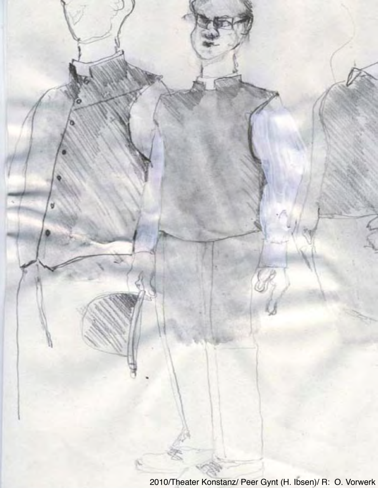
2010/Theater Konstanz/ Peer Gynt (H. Ibsen)/ R: O. Vorwerk