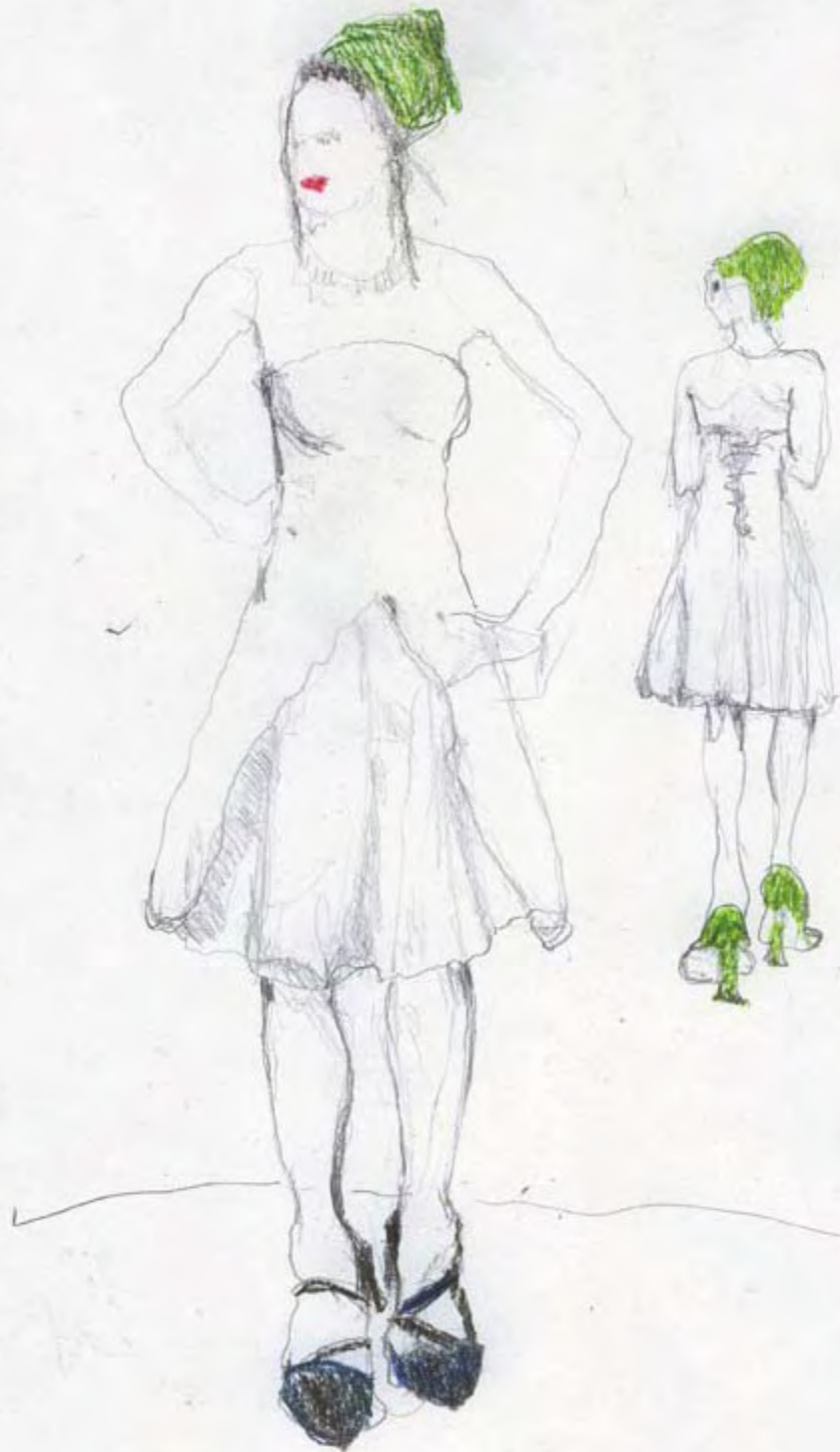
Ingrid, Solveig u. die Grüne Weisses schlichtes Brautkleid mit grünen Absatzen